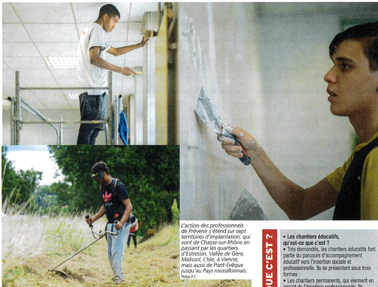
L'action des professionnels de Prévenir s'étend sur sept territoires d'implantation, qui vont de Chasse-sur-Rhône en passant par les quartiers d'Estressin, Vallée de Gère, Malissol, L'Isle, à Vienne, mais aussi de Pont-Evêque jusqu'au Pays roussillonnais.

rupture familiale ou encore dans le cadre d'une transition dans un logement autonome. « On essaie de développer des activités en arboriculture et en vitivulture, pour l'entretien des vignes et vergers. Nous avons cette envie d'investir le côté rural de notre territoire. » Les volontaires participent également à diverses actions, comme "Réveille tes talents" pour redonner confiance et révéler des compétences. Certaines ne seront pas reconduites mais d'autres les remplaceront selon les besoins identifiés. C'est par exemple le cas