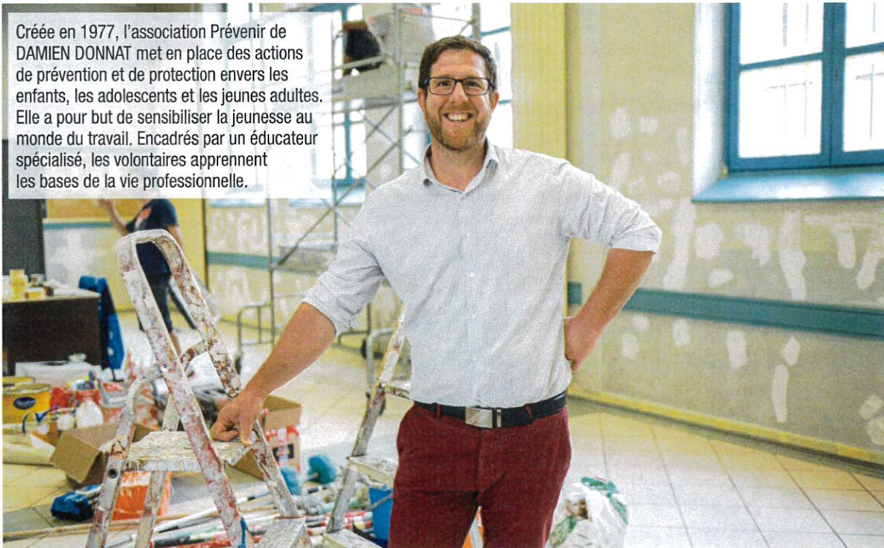
Dans chaque quartier, Prévenir dispose d'un local pour rencontrer les jeunes et les familles durant des permanences.

Créée en 1977, l'association Prévenir de DAMIEN DONNAT met en place des actions de prévention et de protection envers les enfants, les adolescents et les jeunes adultes. Elle a pour but de sensibiliser la jeunesse au monde du travail. Encadrés par un éducateur spécialisé, les volontaires apprennent les bases de la vie professionnelle.